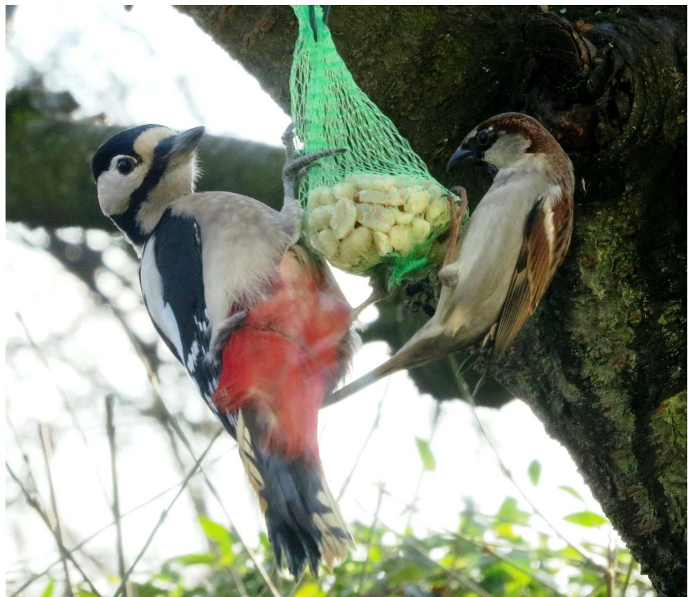
Buntspecht und Haussperlings-Männchen gemeinsam am Erdnuss-Säckchen.