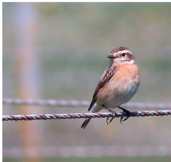
Männlicher Bluthänfling Linnaria cannabina (links) und männliches Braunkehlchen Saxicola rubetra auf dem Koppelzaun an einer Pferdeweide.