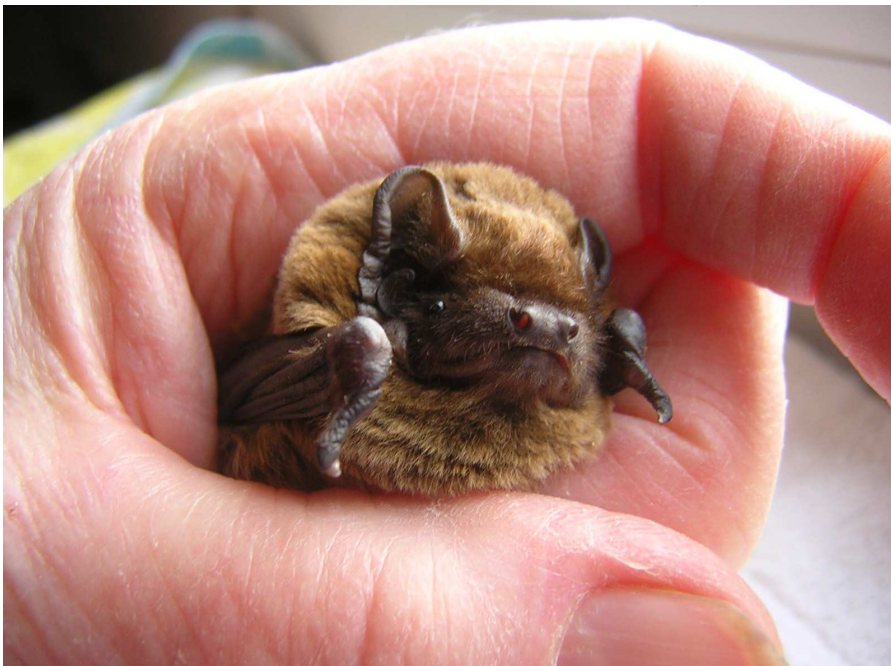
Kleiner Abendsegler Nyctalus leisleri in menschlicher Obhut. Foto: P. Erlemann, 4.3.2009

Nach dieser Einführung ging es zum nahen Naturschutzgebiet See am Goldberg, wo mehrere jagende Tiere beobachtet und die Rufe mittels Bat-Detektoren für Menschen hörbar gemacht wurden. So war es am Ende eine gelungene Veranstaltung, in der die „Faszination Fledermäuse“ auf den einen oder anderen Teilnehmer übergesprungen sein könnte.